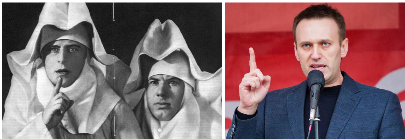
Слева — кадр из советского фильма «Праздник святого Йоргена» (1930 г.). В кадре главный мошеник, которого играет Анатолий Кторов, и его помощник, которого играет Игорь Ильинский. Справа — Алексей Навальный на одном из митингов.

Есть ещё Алексей Анатольевич Навальный и «навальнята». Там тоже нет проекта будущего, одно только неприятие настоящего. Но такая характеристика недостаточна. Писать об этом много нет желания, но картинки ниже показывают суть.