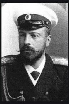
Великий князь Александр Михайлович Романов

“На страже русских национальных интересов стоял не кто иной, как интернационалист Ленин, который в своих постоянных выступлениях не щадил сил, чтобы протестовать против раздела бывшей Российской империи”.