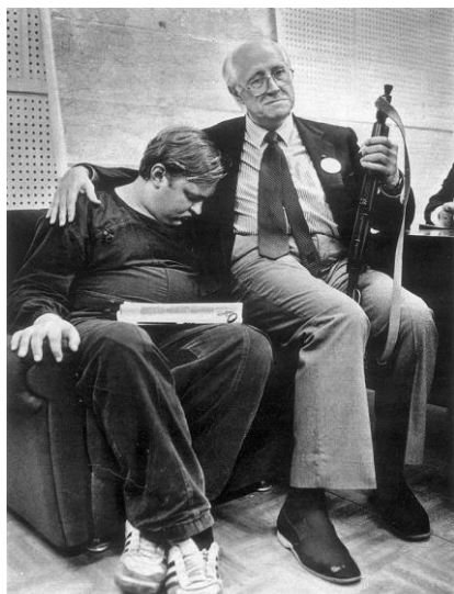
Виолончелист М.Л. Ростропович в здании Верховного Совета РСФСР в дни ГКЧП в 1991 г.

чрезвычайными методами». Результатом той модернизации названо преодоление технологического отставания от западных стран.