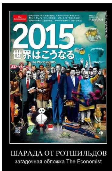
Рис. 1. «ПРОЦЕСС ПОШЁЛ» — ВОПРОС ТОЛЬКО: КУДА?

По отношению к политике люди делятся на три категории: 1) политически безучастные, участь которых — быть жертвами политики, 2) заинтересованные наблюдатели и оценщики-комментаторы, дополняющие политически безучастных в списках жертв политики, 3) практикующие политики (и это не только государственные деятели, чьи слово и подпись придают властную силу тем или иным документам, но и те, кто добивается намеченных политических результатов иными средствами). Редакция журнала