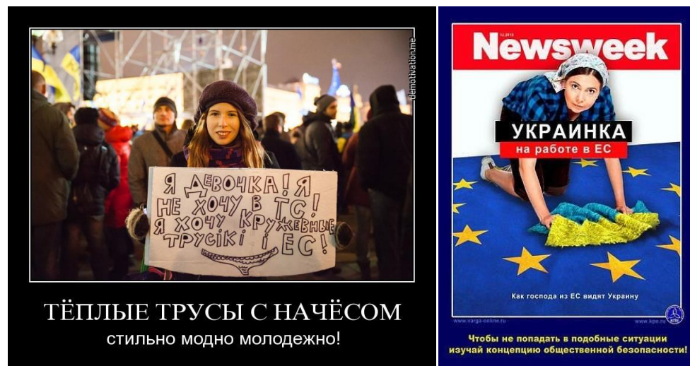
Рис. 4. ВОЖДЕЛЕНИЯ И ПЕРСПЕКТИВЫ В ИХ НАИЛУЧШЕМ ВИДЕ

Изложенное выше в разделе 2.2 — иллюстрация на тему, что течение истории алгоритмично 1 , и носителем алгоритмики, реализовавшейся в конкретном течении свершившихся событий, является коллективная психика общества, с которой взаимодействует психика каждого индивида, частью этого общества являющегося.